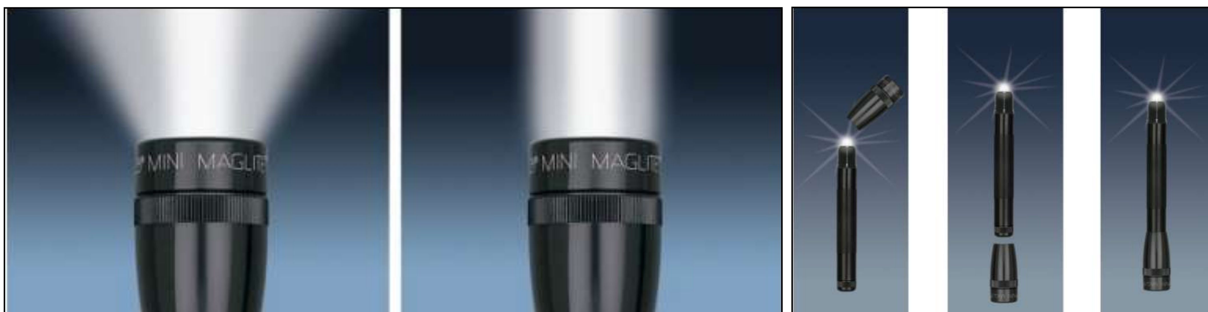
Messa a fuoco